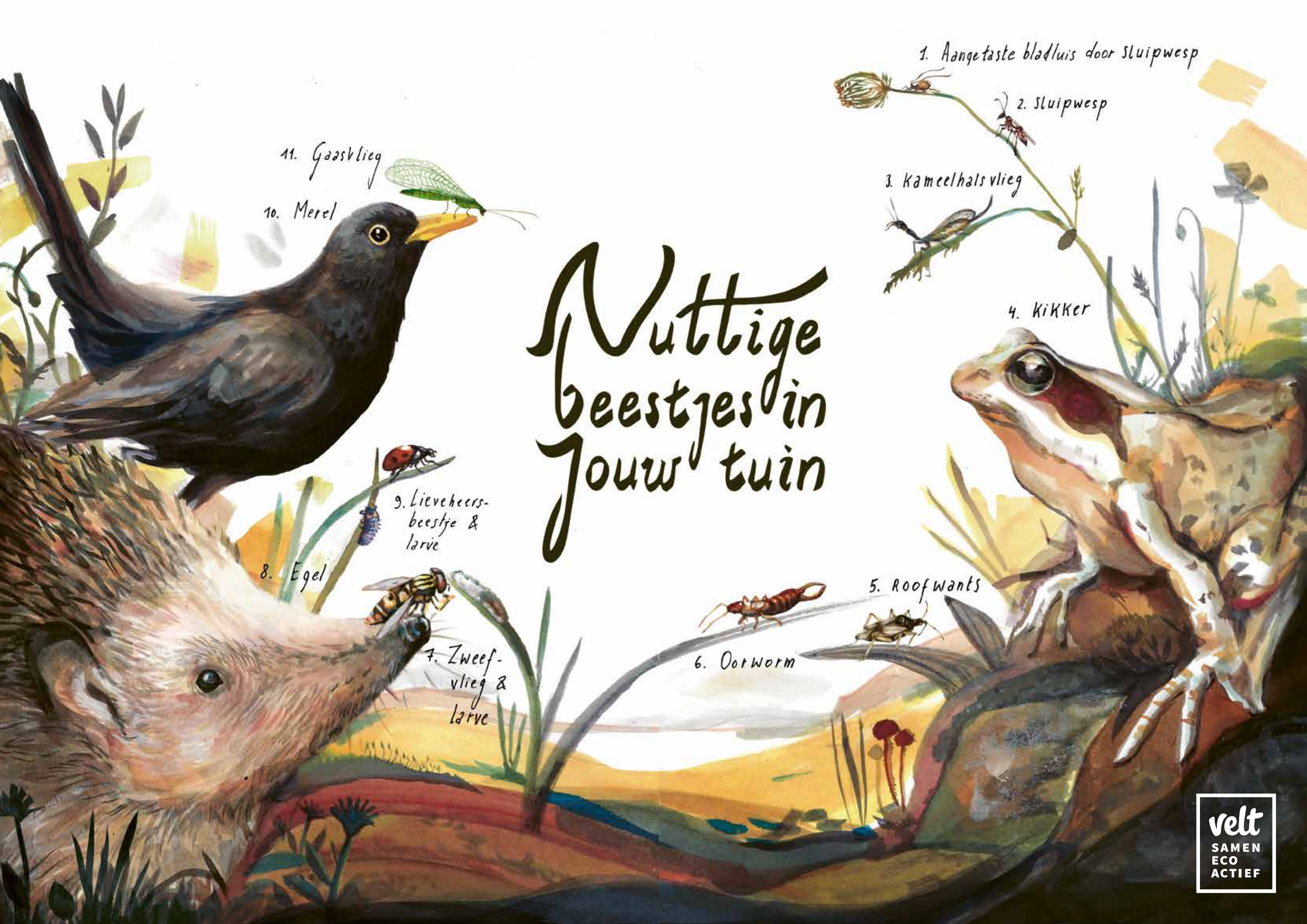
1. Aangetaste bladluis door sluipwesp