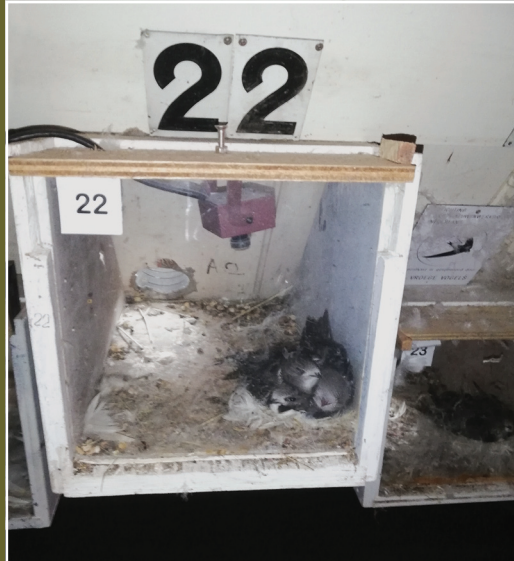
Nestkast met Gierzwaluw in de Lutherse Kerk van Groede.