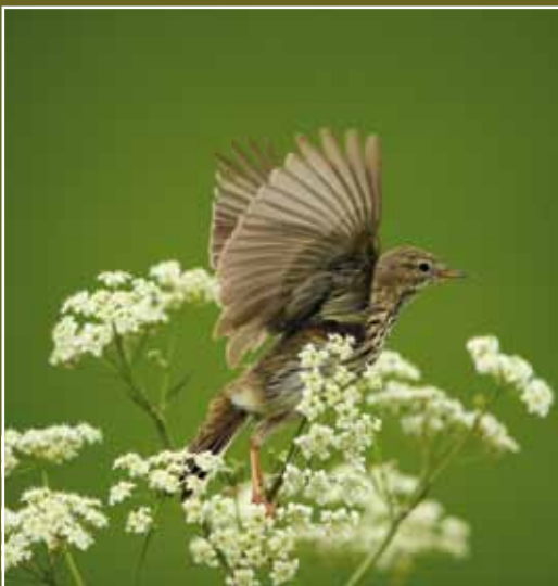
Graspieper en Fluitenkruid

In het najaar volgen de meeste Scandinavische vogels een oostelijker gelegen trekroute, terwijl de route in het voorjaar westelijker is. Daardoor zien we in Zeeland het najaar minder vogels dan in het voorjaar. Waarnemingen van Beflijsters in de winter zijn uitzonderlijk en betreffen meestal jonge vogels.