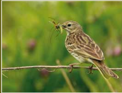
Graspieper met voer voor jongen

De hoogste dichtheden worden als vanouds bereikt in reliëfrijke graslanden, hoge schorren en andere open natuurgebieden zoals het Paulinaschor bij Biervliet. Dirk Verroken telde er in 2020 wel 26 paar. Hoewel nog algemeen, is de stand van de Graspieper sinds de jaren zeventig en tachtig gehalveerd. Deze aderslating kwam vooral door schaalvergroting en ontwatering en het verdwijnen van licht verruigd en reliëfrijk grasland. Opvallend is het nog steeds talrijke voorkomen op grazige (zee)dijken, waar de Graspieper vaak een van de weinige broedvogels is.