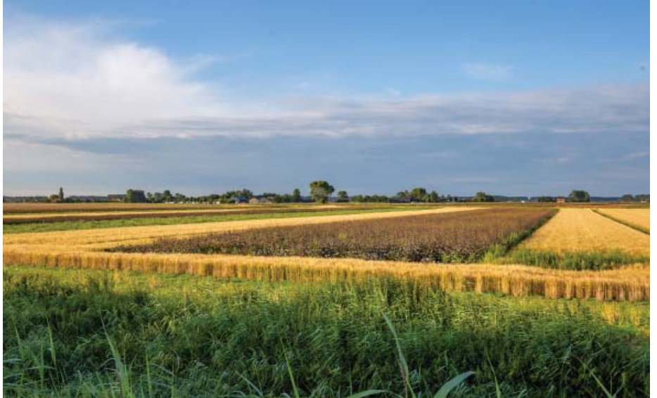
Strokenteelt in Heerenpolder