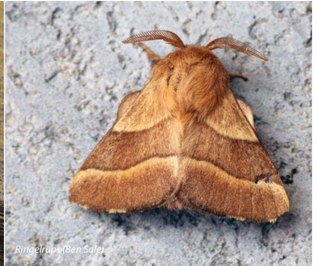
Ringelrups (Ben Sale)