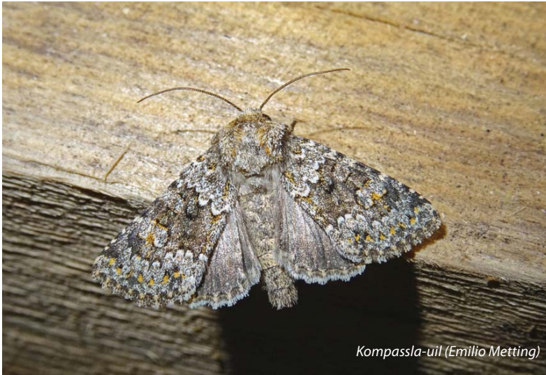
Kompassla-uil (Emilio Metting)